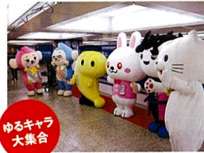
ゆるキャラ大集合

昨年、大好評だったドゥーストリオによる生演奏ステージや各種クイズ大会、輪投げ、ガラポン、はかりチャレンジ、スタンプラリー、ゆるキャラ大集合など盛りだくさん。小さなお子様からお年寄りまで家族で楽しめるイベントです！！