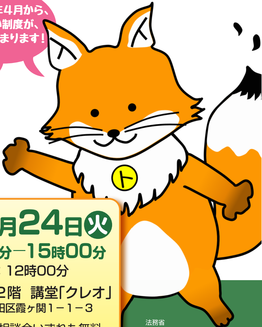
法務省 不動産登記推進イメージキャラクター 「トウキツネ」