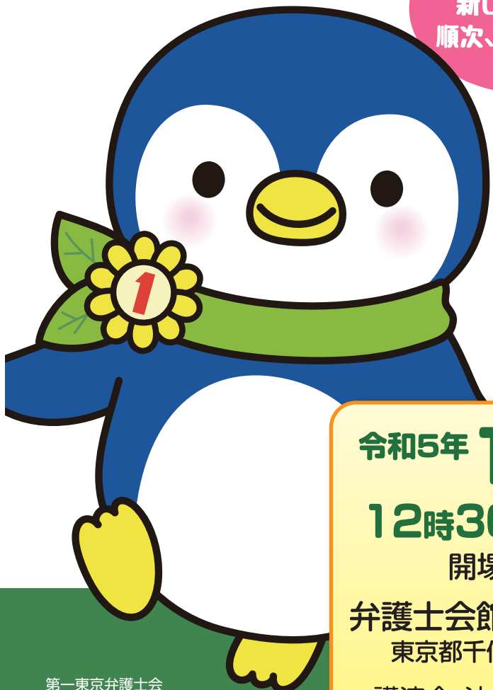
第一東京弁護士会 マスコットキャラクター「いちぺん」